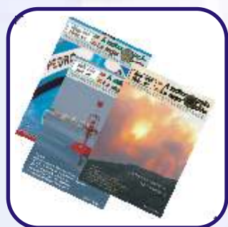
Revista "A Melhor Opção / La Mejor Opción"

Campanha mínima na rádio, 90 spots. 225 € + IVA .