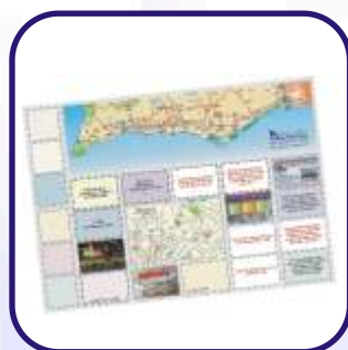
Mapa-Guia do Algarve