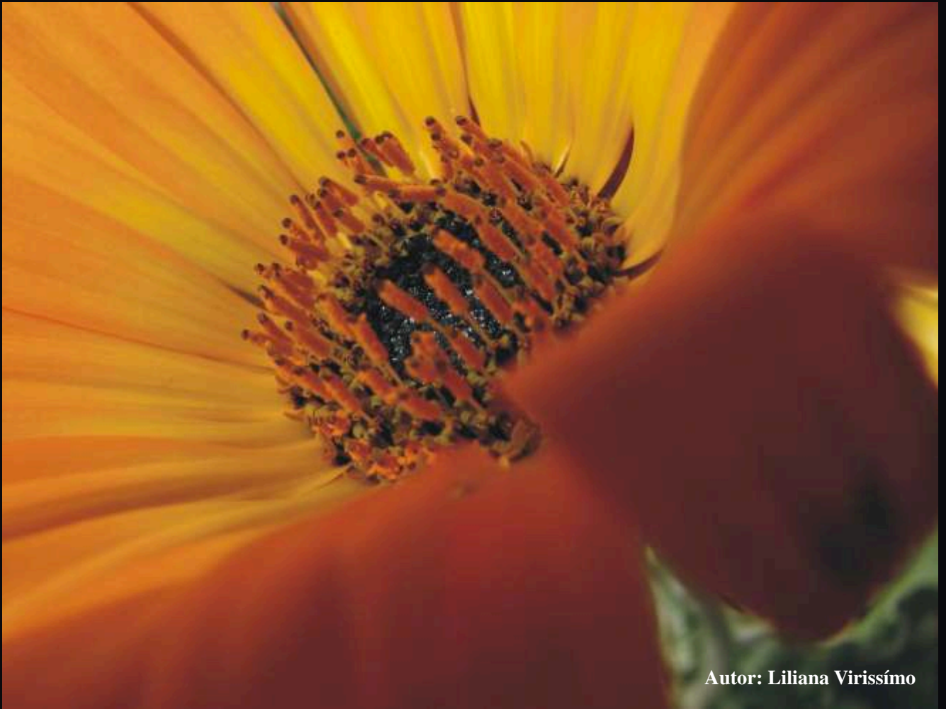
Autor: Liliana Viríssimo