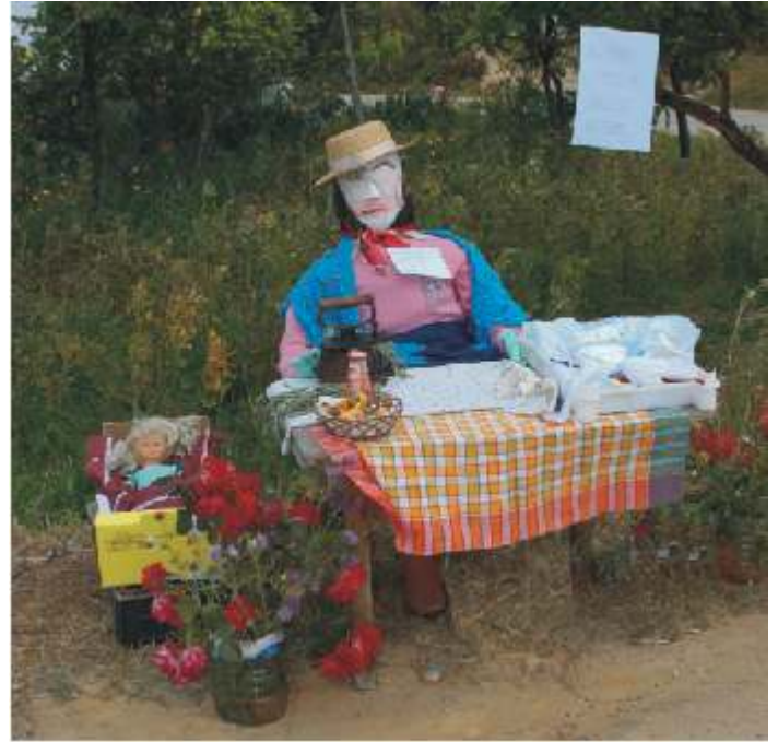
Descubra as 7 diferenças entre as duas imagens. Solução na próxima edição.