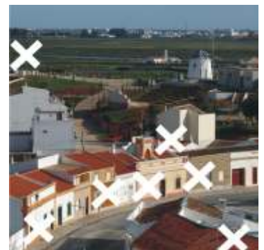
Solução da edição anterior / Solución de la edición anterior: