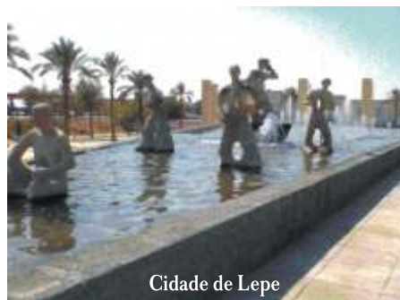
Cidade de Lepe